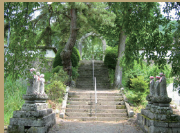
真田氏の菩提寺、長谷寺