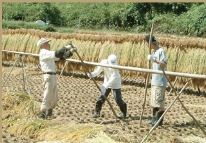
はぜかけの手伝い