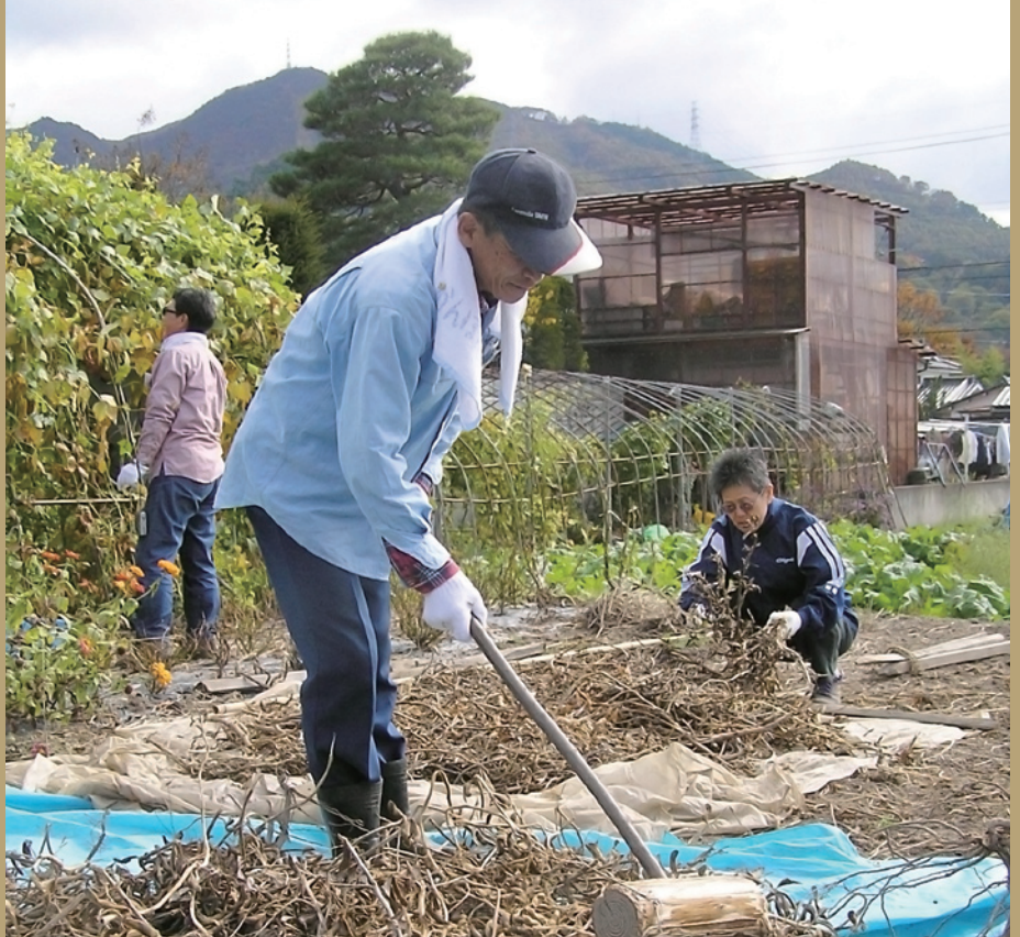
「農家の味噌」になる大豆の脱穀