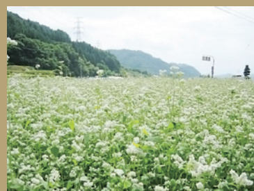
美味しいソバを食いたいな