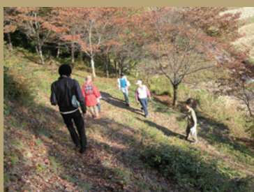
幸村もこの道を歩いたかも