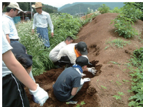
カブトムシの幼虫探し