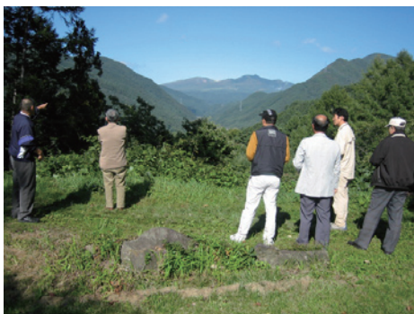
真田氏が見ていた風景