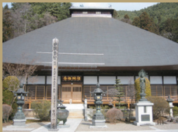
真田昌幸が建立した信綱寺