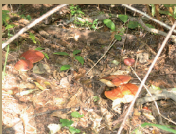
自然のたくましさ気づく