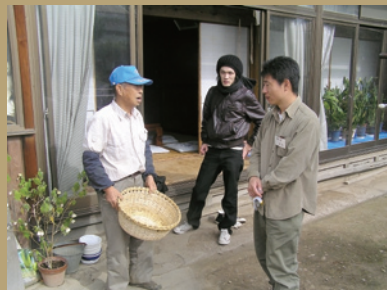
習慣・知恵を聞いてみる