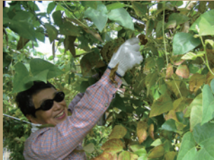
インゲン豆の収穫