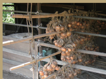
生きるための知恵を知る