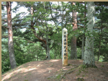
上田城築城以前の真田氏本城跡