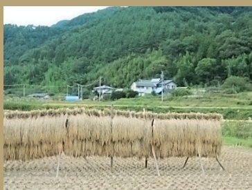
日常の食を考える