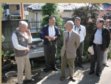
出会いは縁 とても大切